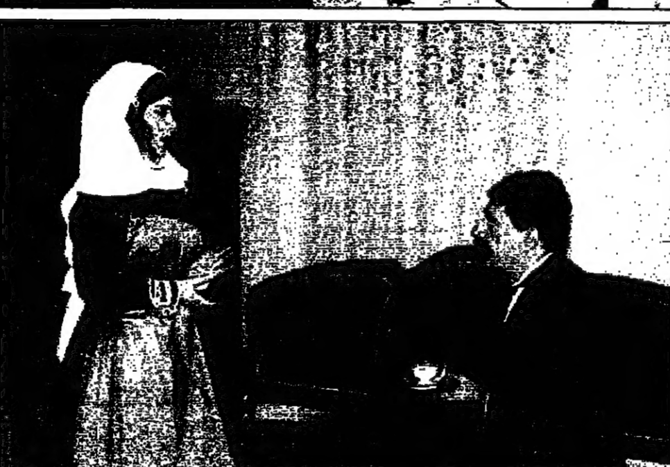
فوزي شهيد من ايام الشباب، وفي الاصل مشهد من «القدس العربي»

في سورية كان موزعا بين عدد من اساليب العمل المختلفة وبحث فرقا غنية للعمل، والجمهور الذي يبحث له ايضا فرصة مشاهدة انماط مختلفة، بل ومتناقضة احيانا من الابداع الفني.